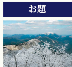
『霧氷』 冬の山々では氷の芸術といえる霧氷が見られます。 「高見山地が眺望できる高見山山頂展望台」(東吉野村)