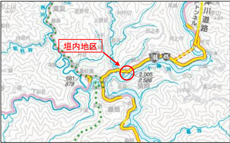
奈良県道路網図(平27情使第780号)を転載