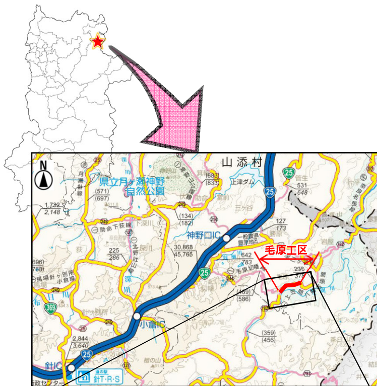
〔奈良県道路網図(平28情使、第861号)を転載〕