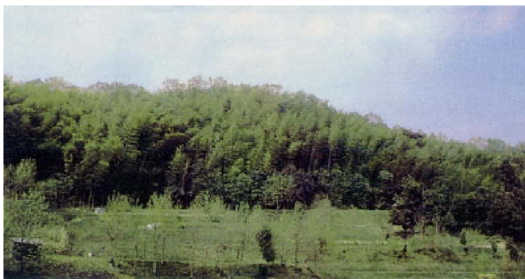
竹林が隣接する里山林等に侵入し、山全体が竹林となった状況