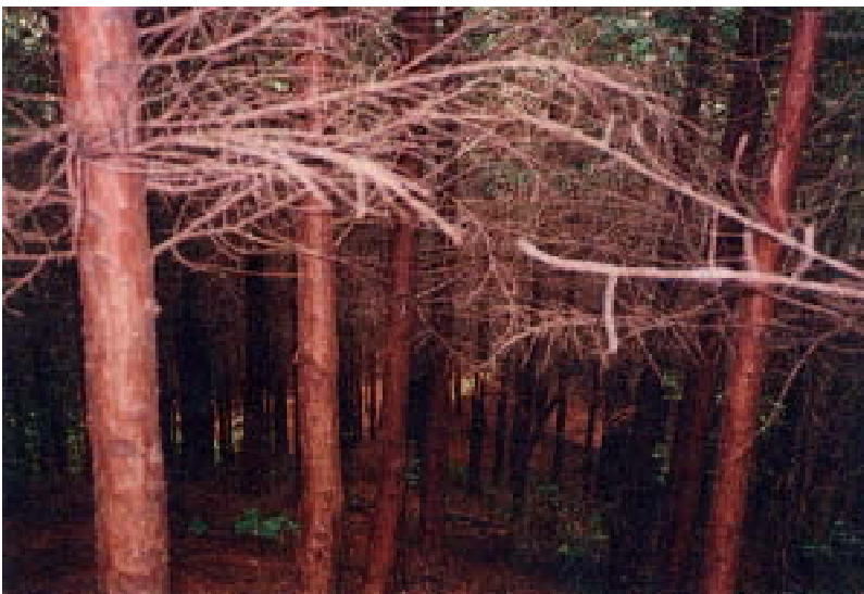
放置された人工林