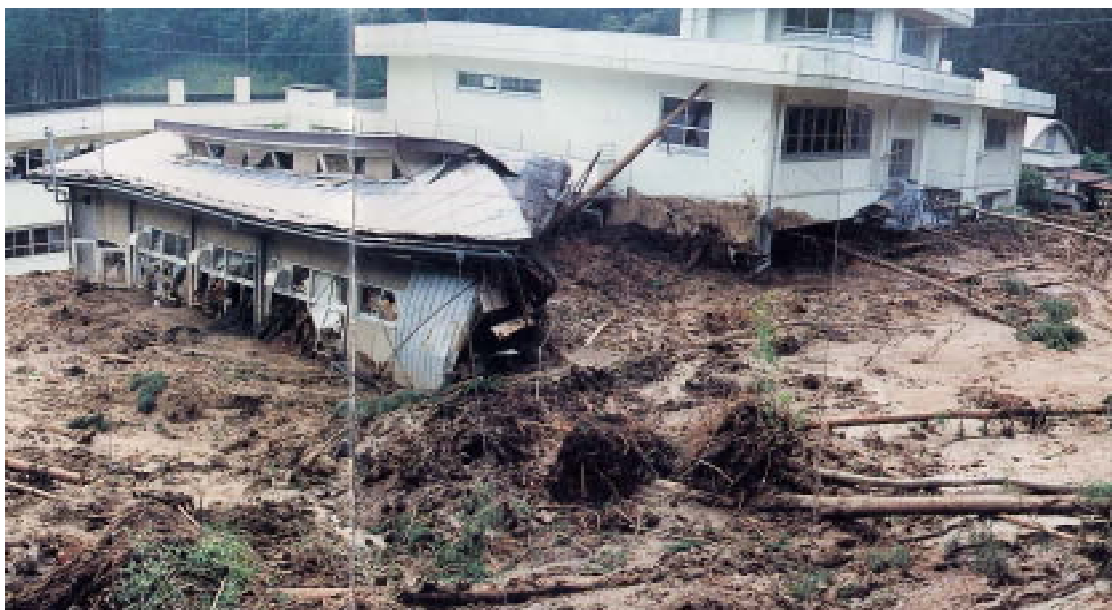
流れ出した土砂により破壊された建物