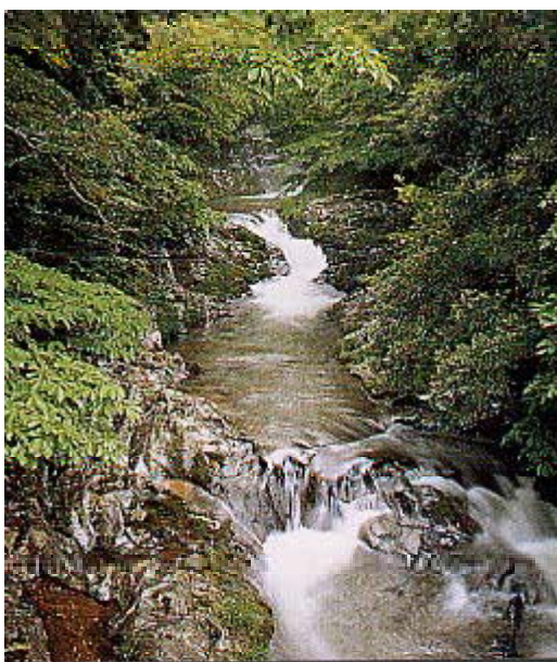
清純な清水が流れる溪流