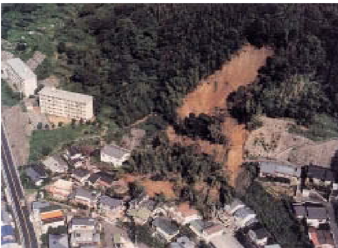
豪雨により発生した山崩れ