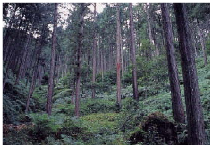
整備されたヒノキの人工林