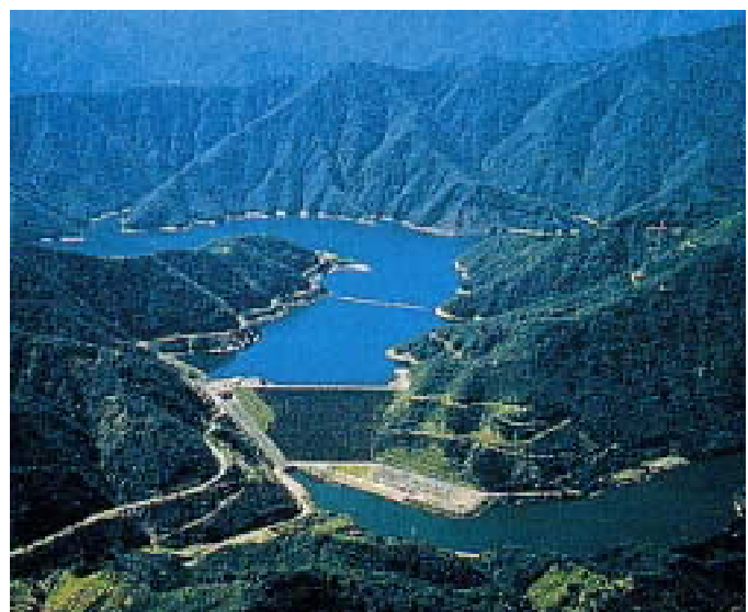
水を育む豊かな森林