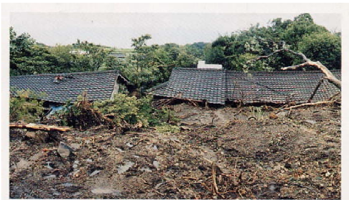
川の氾濫により被災した人家