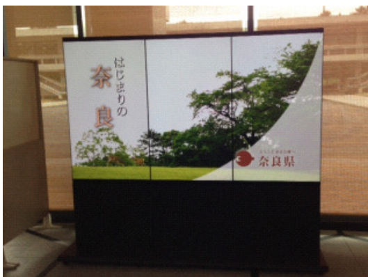
◆ 情報の更新が簡単なデジタルサイネージを活用