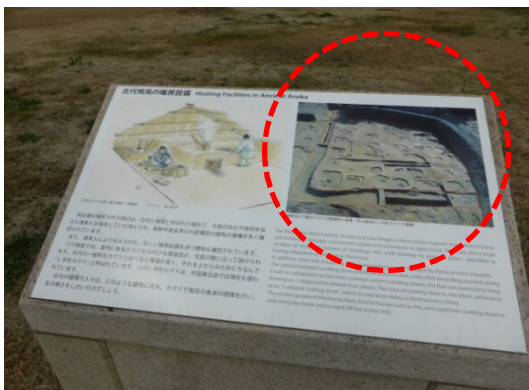
◆ 地下の遺構(写真)を表示した解説板の事例 : 国営飛鳥歴史公園キトラ地区