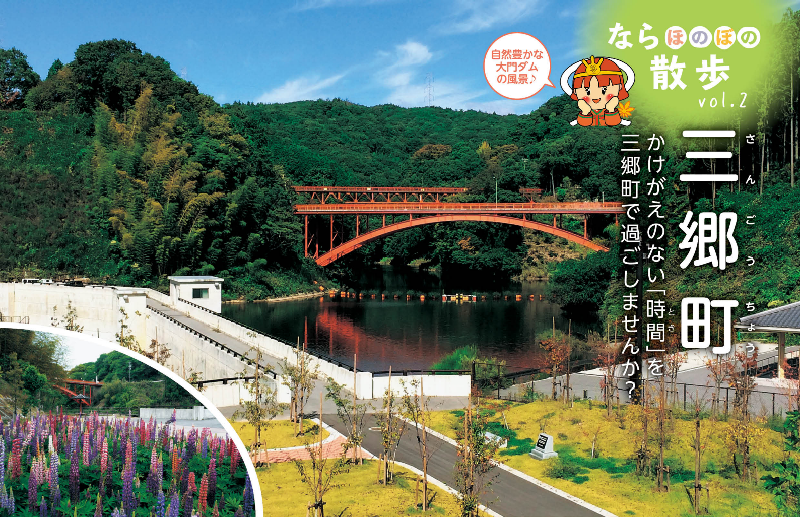
「なら四季彩の庭」山と水辺に映える彩りを感じてみませんか。