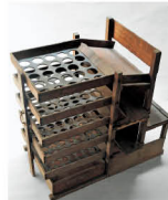
モノとくらしのデザイン —しくみとはたらき—