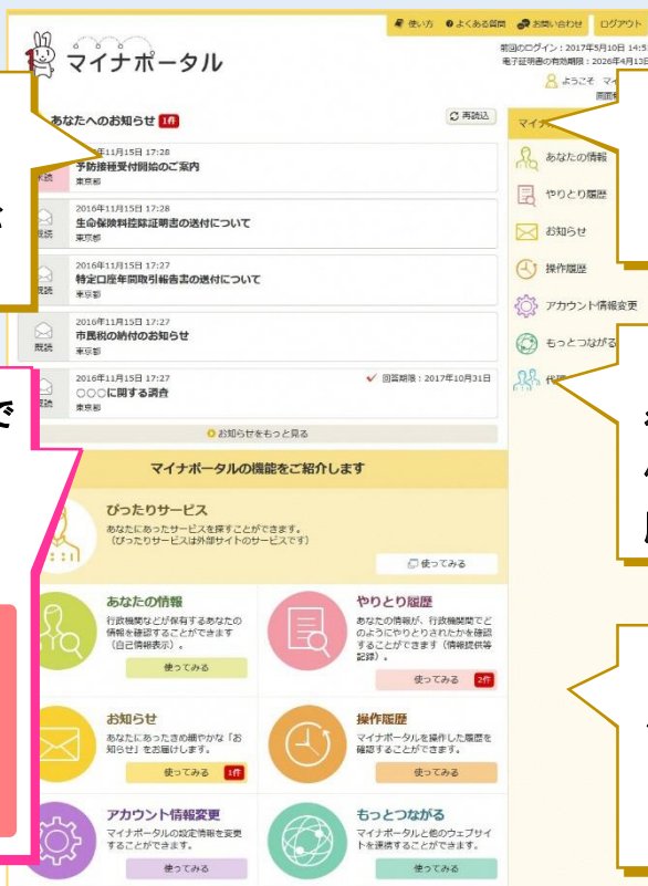
※画面は開発中のものです。

「もっとつながる」で 外部サイトを登録すること で、外部サイトへのログイン が簡単にできます