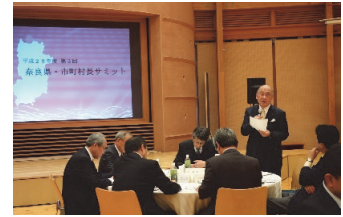
奈良県・市町村長サミット

市町村が行財政問題をはじめとする地域の課題を解決するため、県と市町村、市町村間の連携・協働の取組等の積極的な支援を行い、奈良県を元気にします。