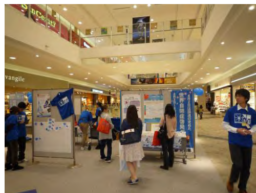
▲イオンモール郡山でのプレイイベント

啓発の取り組みに多くの県民が参加されました。新聞やFM放送などがこの事業の様子を取り上げてくださいました。ぜひ来年度も続けられることを願っています。