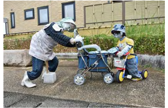
▲町家の案山子めぐり おばあちゃんと孫