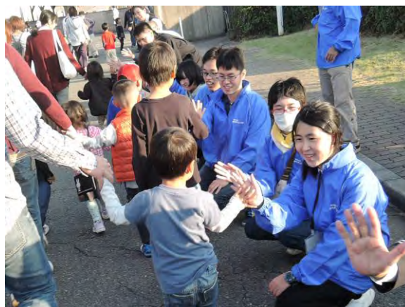
▲きんてつ鉄道まつり

当法人は、生徒と地域社会をつなぐ役割を引き続き担い、特別支援学校生徒の社会参加および就労支援を推進します。