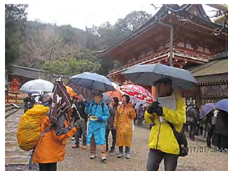
▲活動の様子(医師と歩く初詣ウォーク)

より多くの人々にスポーツ・レクリエーション活動を楽しむ機会を提供することを目指します。そして、これまで以上に奈良県関係部課や県下各市町村との連携を深め、とくに子どもや高齢者を対象とした福祉関連分野及び地域の関係団体、指導者、専門家等の人達との連携促進を進め、公益性の高い事業を実践します。そのため、会員はもとより、レクリエーション活動を担う人材の拡充・育成事業を強化し、各々スキルアップを図り、更により良い市民サービス型事業を展開していくよう努めていきます。