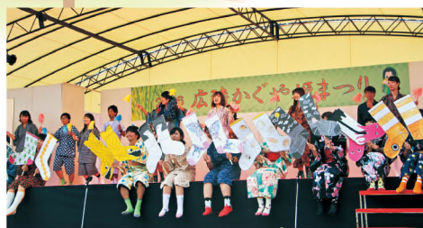
広陵かぐや姫まつり(竹取公園)

問 県地域デザイン推進課 ☎0742-27-5433 FAX 0742-27-7685