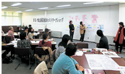
地域でのまちづくりワークショップのようす