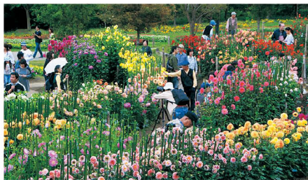
馬見フラワーフェスタ(県営馬見丘陵公園)