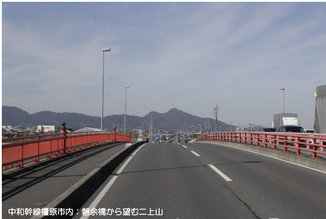
中和幹線橿原市内：磐余橋から望む二上山