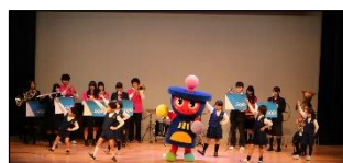
五條市立五條小学校 五夢りんキッズダンス