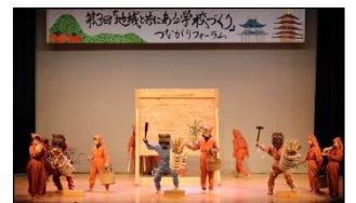
【実践発表】五條市立阪合部小学校 「子ども鬼はしり」