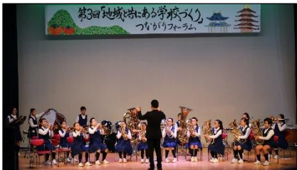
五條市立五條小学校金管バンド