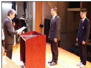
県立王寺工業高等学校