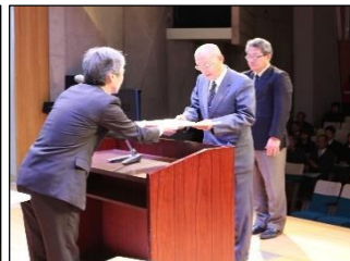
五條市立阪合部小学校 コミュニティ協議会