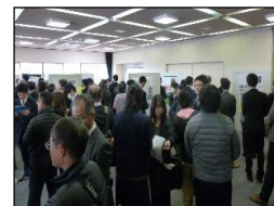
ポスターセッション