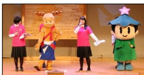
県立五條高等学校 ボランティア