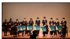
県立五條高等学校 吹奏楽部・コーラス部