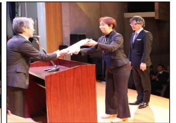
王寺町立王寺小学校 コミュニティ協議会