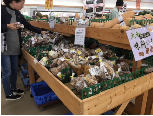
まほろばキッチンで販売