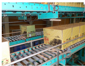
産地事例調査（福井県）