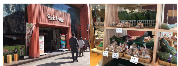
東京まほろば館等でニーズ調査