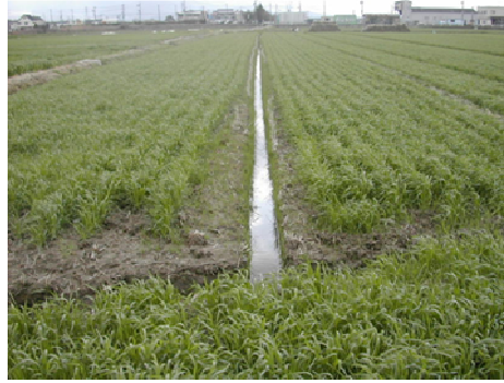
明礬による排水対策