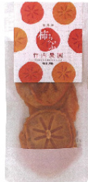
パッケージデザイン改善支援例

南部農林振興事務所農業普及課 担当：担い手・農地マネジメント係 門 地域資源加工品の魅力向上支援事業