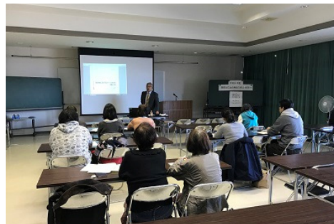
6次産業化セミナーの開催