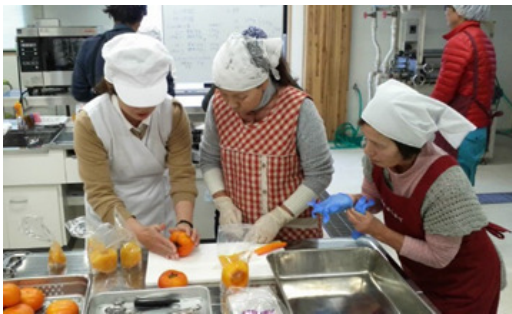
柿の糖蜜漬け研修会の開催

今後も研修会等を開催し、農産物加工品の販売力の向上を支援。「柿の糖蜜漬け」については既に生産販売をしている女性農産物加工グループに対して、作業効率の改善についてさらに支援を実施。他の研修受講者については、「柿の糖蜜漬け」の生産販売の状況について確認するとともに、生産していない場合、原因の分析を実施。