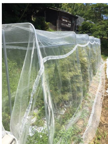
防虫ネットを利用した採種