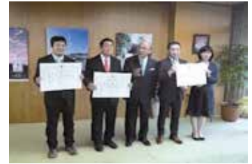
「奈良県社員・シャイン職場づくり推進企業」表彰式