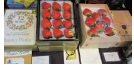
百貨店で販売されるプレミアム品イチゴ

農業・畜産業・水産業と農村が持つ資源を最大限に発揮させることにより、奈良らしい農・畜産・水産業の振興と農村の活性化を図ります。