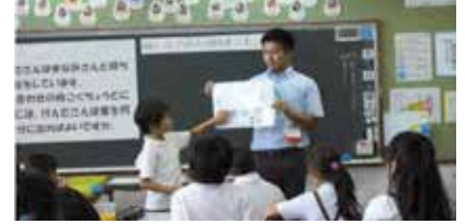
グループによる話し合いの発表