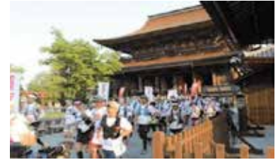
Kobo Trail 2017【K to K】

魅力的な観光資源づくりや、情報発信の強化、多様なイベントの開催、仕事の確保や医療・福祉、教育等の充実、災害への備え等を進め、南部地域・東部地域を「頻りに訪れてもらえる、住み続けられる」地域にします。