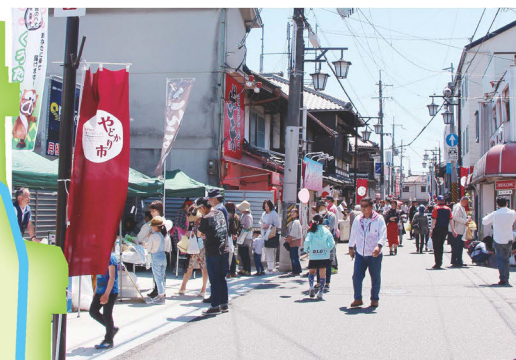
地域活性化イベント「やどかり市」