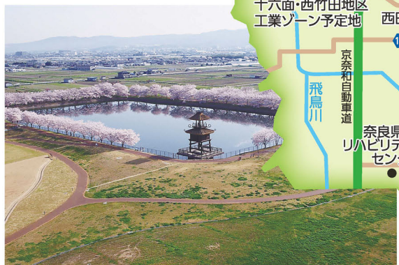
唐古・鍵遺跡史跡公園