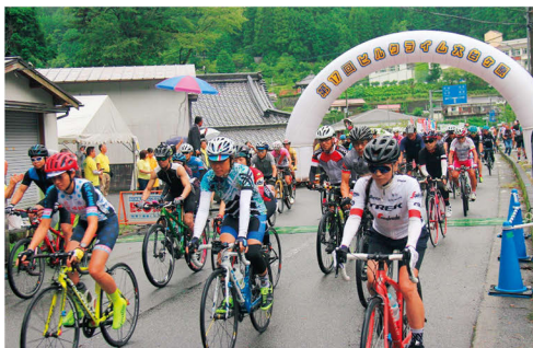
ヒルクライム大台ヶ原 since 2001