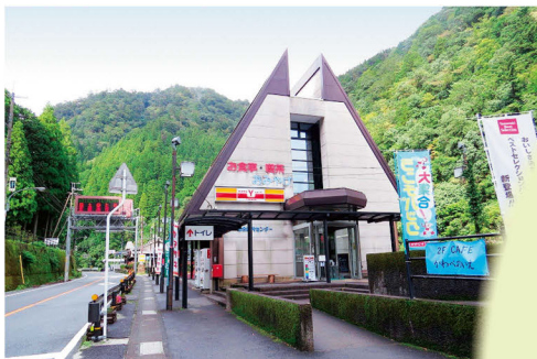
道の駅「吉野路上北山」