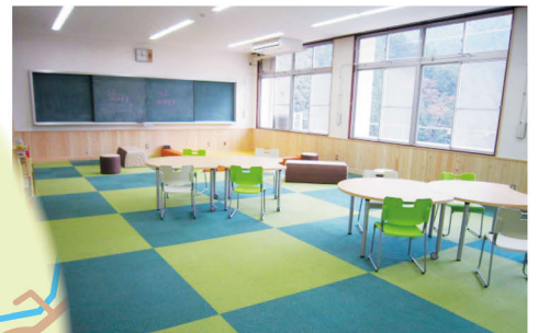
とちの木センター キッズルーム (旧上北山小学校を改修)