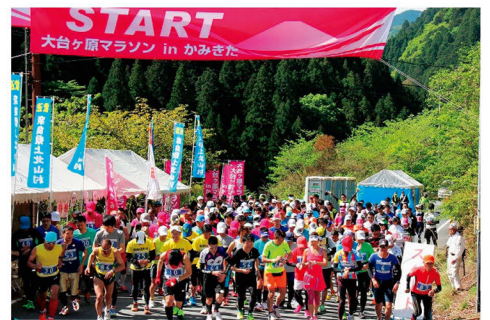
大台ヶ原マラソン in かみきた