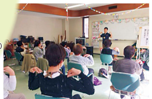
「ワースリビングかみきた」での認知症予防教室