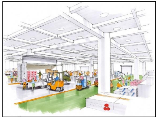
既存卸売場改修部イメージ