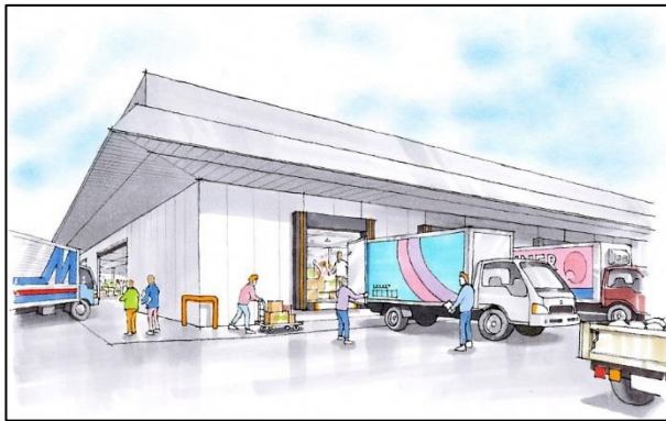
市場機能棟北西から加工場・冷蔵庫棟を見る