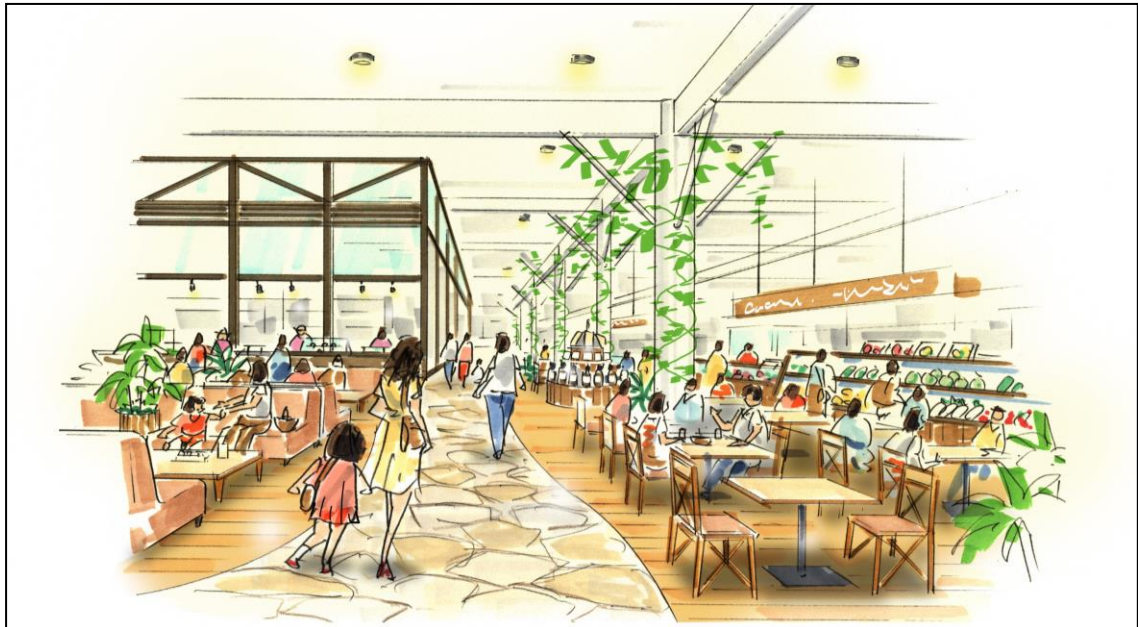
図表 8.4 賑わい創出エリアフードホール 内観イメージ