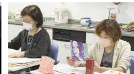
市民生活協同組合ならコープ：社内研修