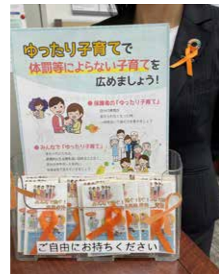
三井住友信託銀行(株)：窓口

今年度初めて、倶楽部統一取組として11月の「児童虐待防止月間」(オレンジリボンキャンペーン)、11月12日～25日の「女性に対する暴力をなくす運動」(パープルリボンキャンペーン)の啓発活動について、13の会員企業がその企業内外において独自の取組を実施しました。