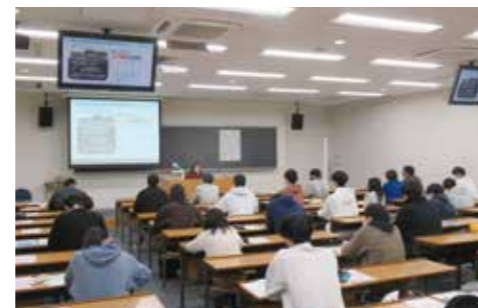
熱心に講義を聴く学生