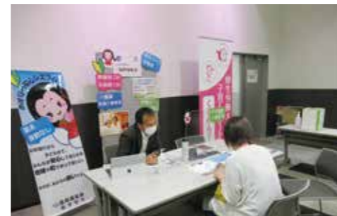
個別のブースで企業と女性が交流