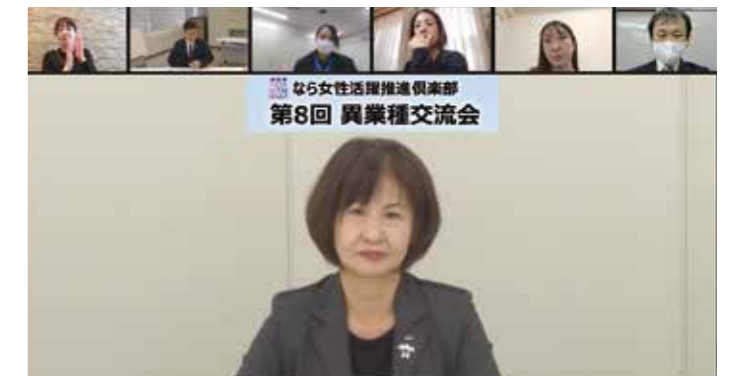
②第8回オンラインセミナーの様子(PC画面)