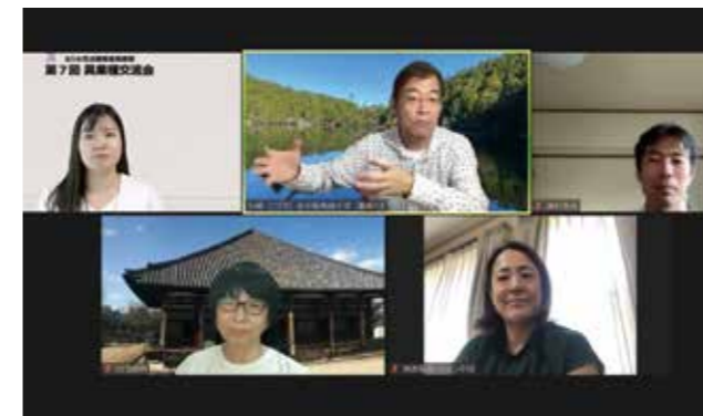
①第7回オンラインセミナーの様子(PC画面)

【参加者より】「D&Iに理解を得られない上司への対し方」など具体的な取組事例が参考になりました！