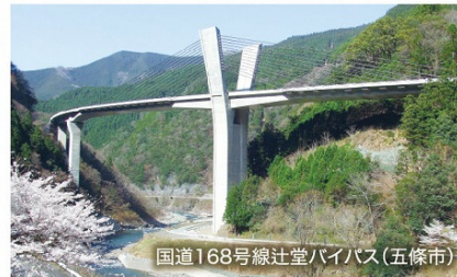
国道168号線辻堂バイパス(五條市)