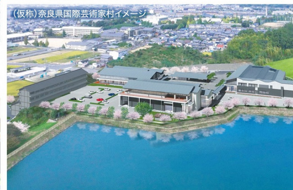
(仮称)奈良県国際芸術家村イメージ