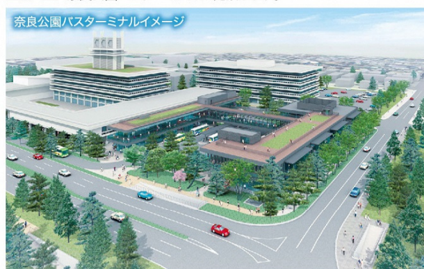
奈良公園バスターミナルイメージ

2019年春に歴史展示施設や飲食・物販施設を備える 奈良公園バスターミナルが完成します。