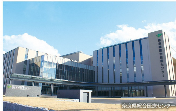
奈良県総合医療センター