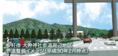
接井市・大神神社参道周辺地区 参道整備イメージ(平成30年2月時点)