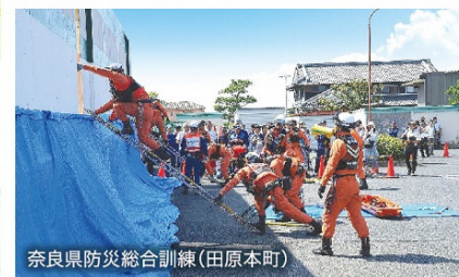
奈良県防災総合訓練(田原本町)