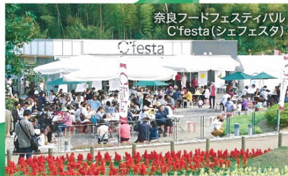
奈良フードフェスティバル C'festa (シェフェスタ)