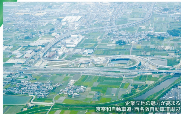
企業立地の魅力が高まる 京奈和自動車道・西名阪自動車道周辺