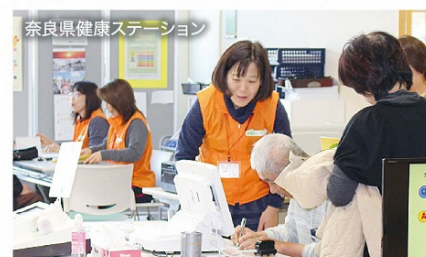
奈良県健康ステーション