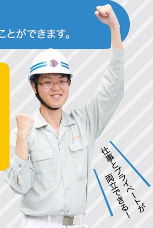
仕事以外の時間を 自分のために