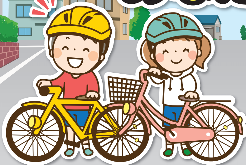
子どもが自転車に乗るとき