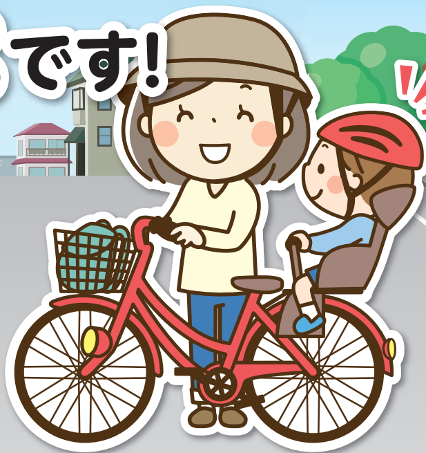
子どもを自転車の幼児用座席に乗せるとき