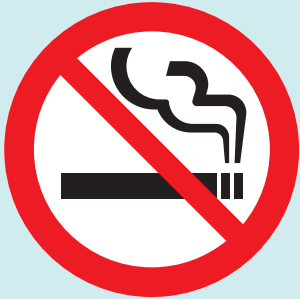
多くの施設において 原則屋内禁煙に

2019年7月から、病院や学校、行政機関で原則敷地内禁煙のルールがスタートしました。そして2020年4月、飲食店やオフィス・事業所などでも、原則屋内禁煙となるほか、20歳未満の方の喫煙エリアへの立入禁止などを加えた改正健康増進法が全面施行されます。