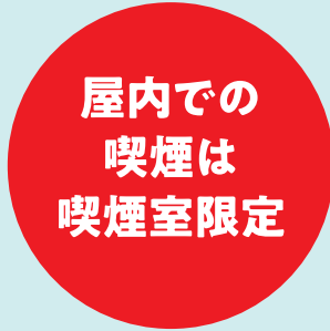
屋内での喫煙には 喫煙室の設置が必要に