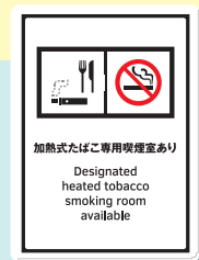
加熱式たばこ 専用喫煙室あり