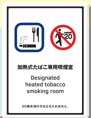
加熱式たばこ 専用喫煙室