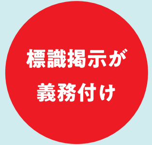
喫煙室には 標識掲示が義務付けに