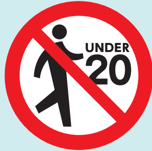
20歳未満の方は 喫煙エリアへ立入禁止に