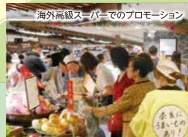
海外高級スーパーでのプロモーション