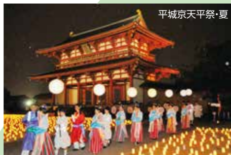
平城京天平祭・夏

奈良が有する観光資源や歴史・文化資源 を活用することで、県内への誘客を促進 し、観光産業を振興します。