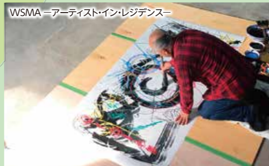
WSMA アーティスト・イン・レジデンス