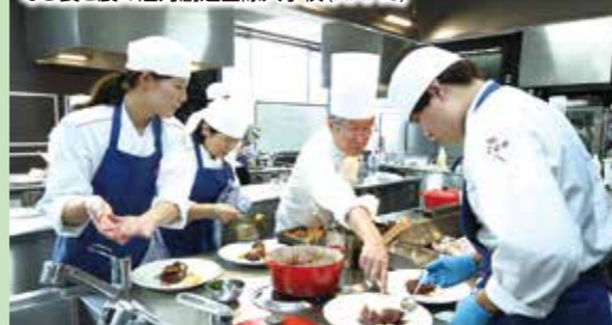
なら食と農の魅力創造国際大学校 (NAFIC)