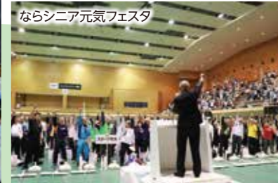
ならシニア元気フェスタ