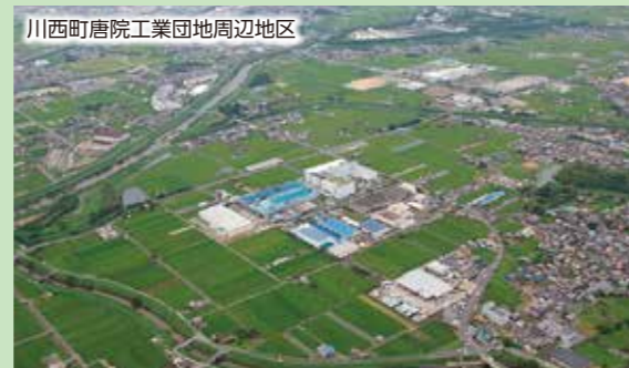
川西町唐院工業団地周辺地区