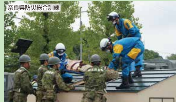
奈良県防災総合訓練