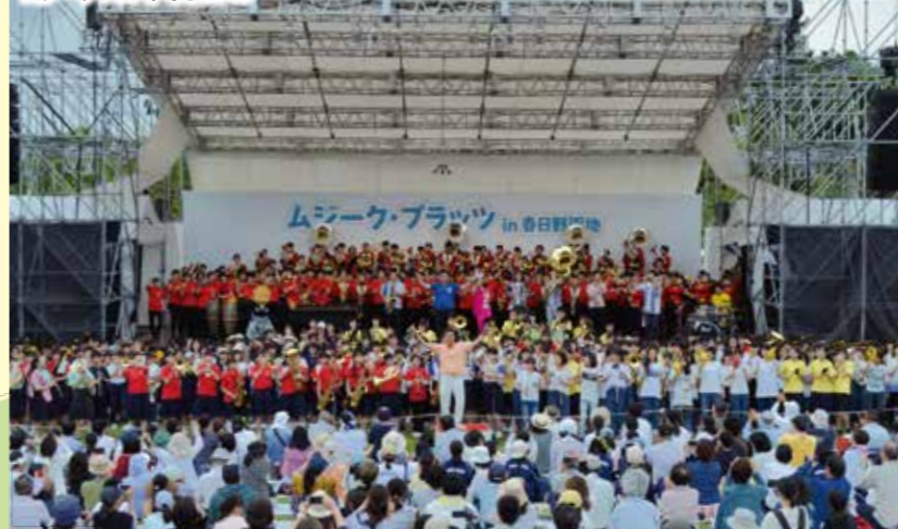
ムジークフェストなら2019