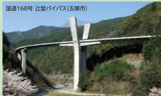
国道168号 辻堂バイパス(五條市)