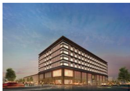
JWマリオット・ホテル奈良(イメージ)