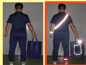
反射材なし 反射材あり