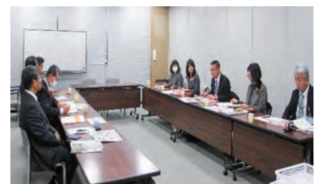
【1月31日第2回推進会議】