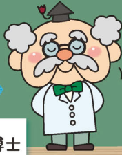
研究一筋 サウスフィールド博士

博士、この前「奈良県は大阪などのベッドタウンとして人口が増加した」って言ってたよね。