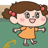
数字大好き ハルちゃん