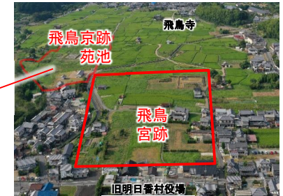
飛鳥京跡苑池と飛鳥宮跡