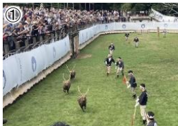
① 鹿の角きり [秋を彩る奈良の伝統行事]

○奈良公園の価値を維持し、更なる魅力の向上のため整備を推進。 ○飛火野周辺地区(鹿苑)では、天然記念物「奈良のシカ」の保護・ 育成施設を整備。