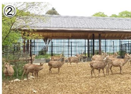
② 鹿の給餌施設(R5整備箇所)