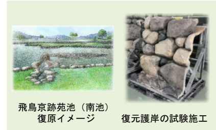
飛鳥京跡苑池(南池) 復元イメージ

○飛鳥宮跡・飛鳥京跡苑池(南池)において、令和9年度の史跡整備 にむけた試験施工等を推進。