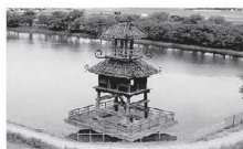
唐古・鍵遺跡の楼閣