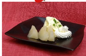
梨のコンポート&アイスデザート 400円(税別)