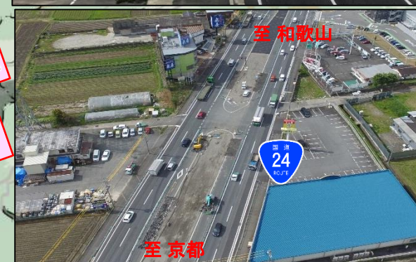
(仮称)奈良IC～郡山下ツ道JCTの工事状況(R2.4)