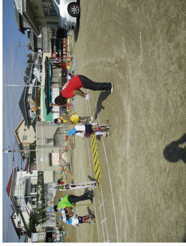
▲自転車交通安全教室の様子