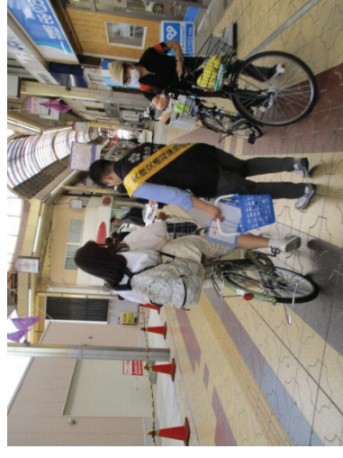
関係機関と協力した安全啓発活動