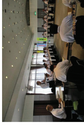
▲奈良県自転車総合対策連絡協議会（令和元年度）