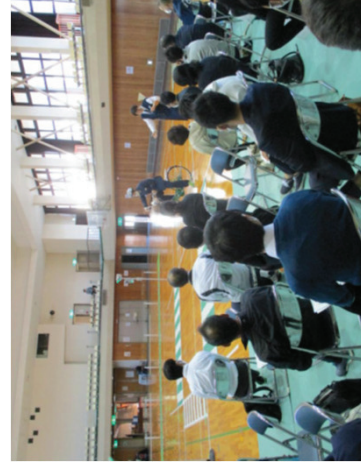
▲教職員に対する交通安全講習 （橿原市中央体育館）（R2年）