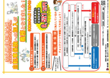
▲ (左) ラジオ放送の様子 (右) 自転車損害賠償保険加入に関するチラシ