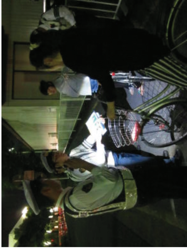
▲自転車利用者に対する指導警告活動の様子