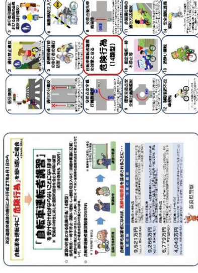
▲自転車運転者講習制度啓発チラシ