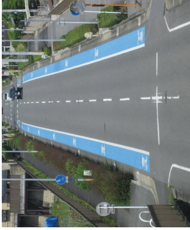
▲広陵町「笠ハリサキ線」自転車専用通行帯