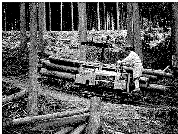
図4 林内作業車による運材

ラジキャリーのリモコン操作を省いて2人作業が可能であれば、労働生産性は3.28m 3 /人・日まで向上することが期待されるが、集材路の開設や伐木造材を含めると、