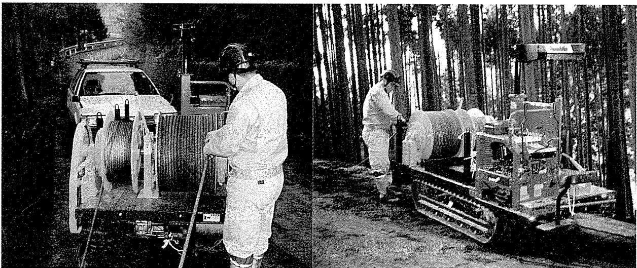
図1 自走式搬器架設支援車両(右:前部、左:後部)

3個のドラムは二つのドラムクラッチでそれぞれ単独に、フリー、正転、逆転が選択できる。各ドラムのワイヤーロープの種類と長さは下記のとおりである。