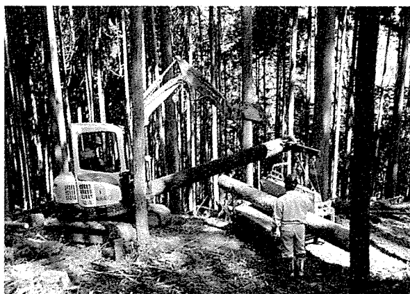
図5 ミニバックホウによる集材作業