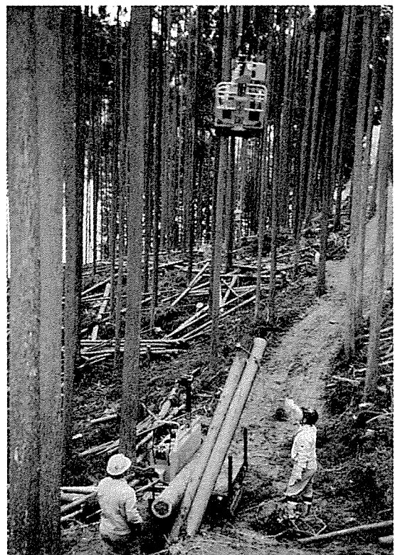
図3 ラジキャリーによる集材作業

先柱付近では主索の高さが低くラジキャリーによる集材ができないため、ウインチ付ミニバックホウと林内作