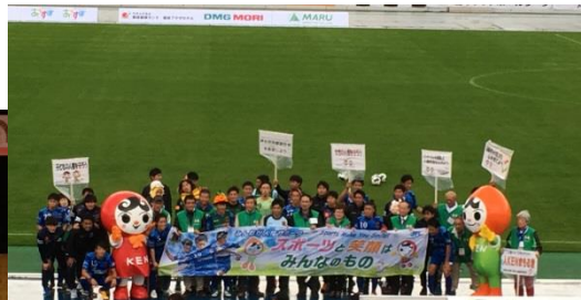
プロサッカーチームと連携した 人権普及・啓発活動 (H29.10.28)