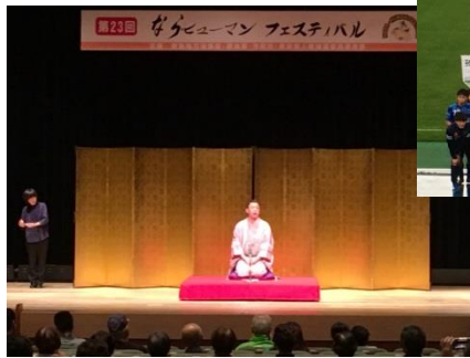
なら・ヒューマンフェスティバル (H29.10.21)