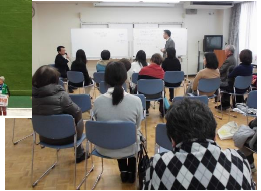
なら人権相談ネットワーク相談員資質向上研修会 (H29:全10回開催)