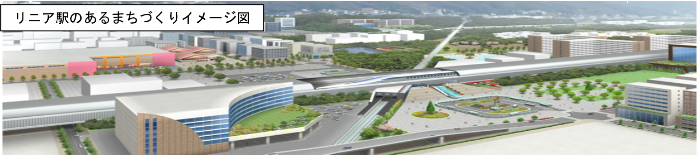
リニア駅のあるまちづくりイメージ図