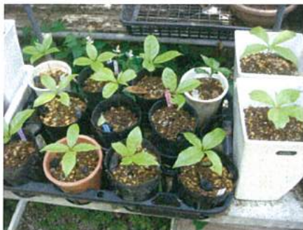
（宝蔵院流槍術保存会 育成中）

まっすぐな主幹および優れた堅さと弾力性を持つことから、槍柄材として江戸幕府将軍家に直納された歴史をもつ。