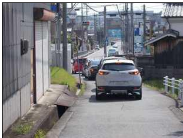
児童が横断する交差点

畠田4丁目交差点付近は、国道25号線から国道168号への抜け道となっており、渋滞原因になっています。