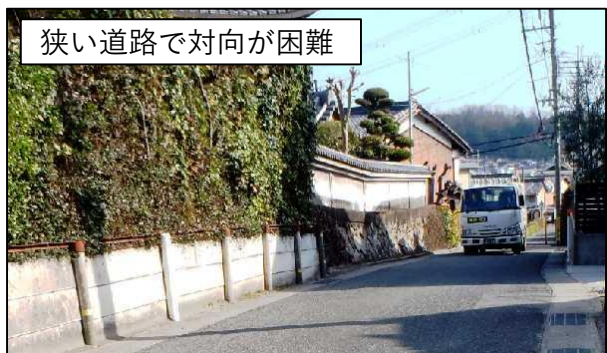
狭い道路で対向が困難

畠田4丁目交差点付近は、国道25号線から国道168号への抜け道となっており、渋滞原因になっています。