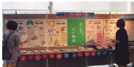
令和2年度のがん検診受診率50%キャンペーンの啓発の様子です。場所:奈良市保健所教育総合センター

令和2年度対象の検診がひとめでわかる「検診パスポート」を個別に送付するとともに、幅広い層へのがん予防・がん検診の啓発を行っています。1人でも多くの方にがん検診を受診いただき、受診率向上につなげられるよう、継続してがん予防・がん検診の啓発に努めます。