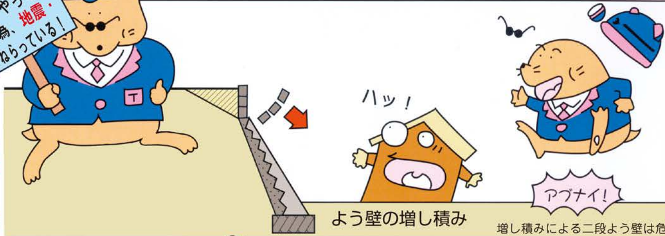
よう壁の増し積み

増し積みによる二段よう壁は危険です。宅地を有効に利用したいときは、よう壁の改修、補強をしましょう。