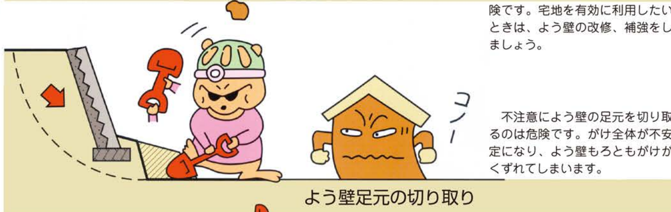
よう壁足元の切り取り

増し積みによる二段よう壁は危険です。宅地を有効に利用したいときは、よう壁の改修、補強をしましょう。