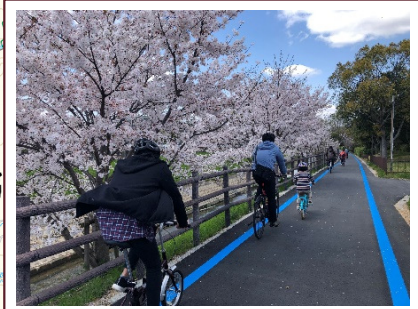
① 奈良市ニヶ辻北町