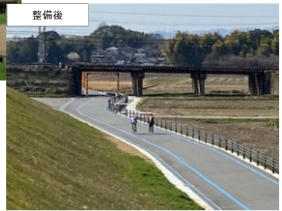
⑤ 大和郡山市長安寺町 (令和2年8月18日供用)