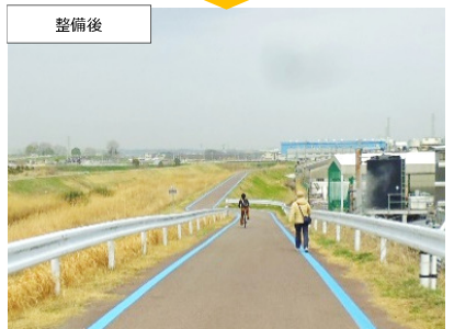
③ 大和郡山市下三橋町 (令和3年4月1日供用)