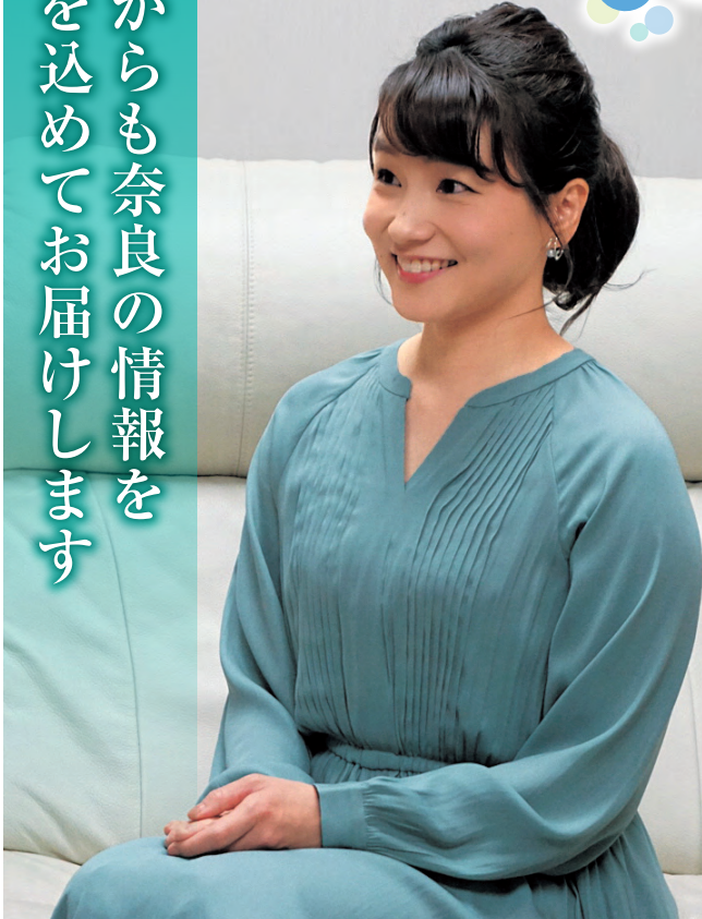
大阪府出身。フリーアナウンサー。 県民だより奈良「なら いいね!」(奈良テレビ放送)MC。