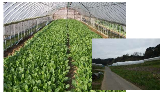
ホウレンソウ(大和高原南部地区)