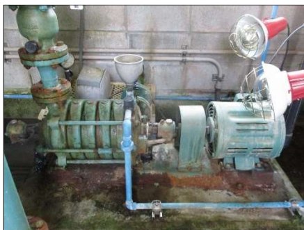
ポンプの老朽化(大和高原南部地区)