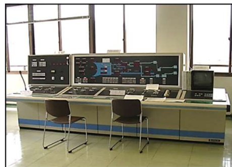
一の木ダム管理機器(五条吉野地区)