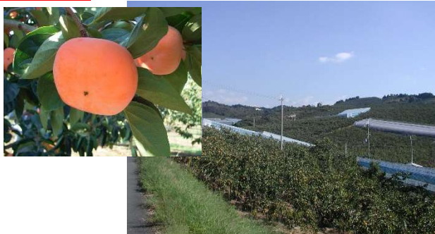
ハウス柿の栽培(五条吉野地区)

しかし、各地区の施設が設置後20年以上経過しており、 安定的な畑かん用水供給に支障 をきたしている状況。