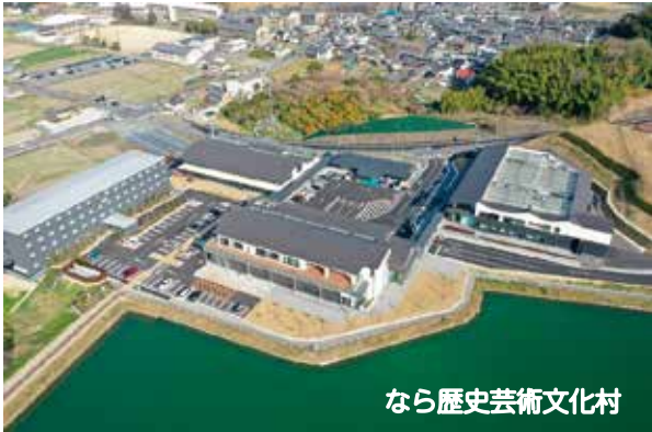
なら歴史芸術文化村

文化の振興、文化財の保存・活用、教育の振興、社会活動の推進、スポーツの振興、子育て支援などに使われます。